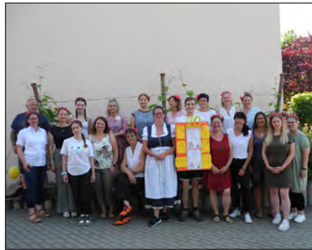
F. Rabis Team Weinbergwichtel

Kinder zum Tanzen, singen und Seifenblasen fangen ein. Kurzum – es war ganz schön was los. Doch auch das schönste Fest geht irgendwann zu Ende, aber nicht ohne noch ein Highlight zu erleben! So kam unser Spielmannszug Weinböhla in die Kita und spielte seine schönsten Stücke für uns. Mit Pauken und Trompeten zogen die letzten Gäste des Festes mit dem Spielmannszug aus der Kita heraus. Wir bedanken uns recht herzlich bei allen Helfern, Gästen, dem Spielmannszug, unseren Eltern, den Praktikanten, einfach allen, die zum Gelingen des Festes beigetragen haben.